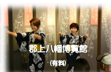
郡上八幡博覧館 (有料)