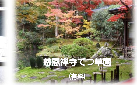
慈恩禅寺てつ草園 (有料)