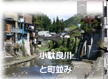
小駄良川 と町並み