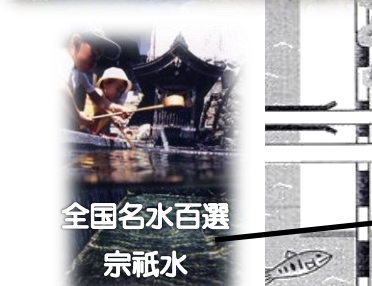
全国名水百選 宗祇水