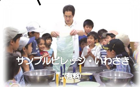
サンプルビレッジ・いわさき (有料)

市街地内は見どころ多数のため、 ..... 線箇所は城下町プラザに駐輪し、徒歩で散策することをおすすめします。