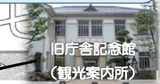
旧庁舎記念館 (観光案内所)