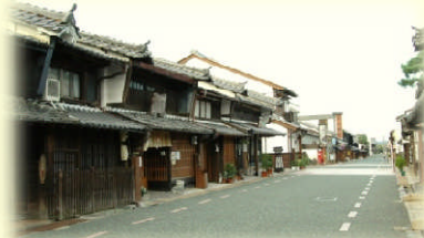
うだつの上がる町並み (美濃市)