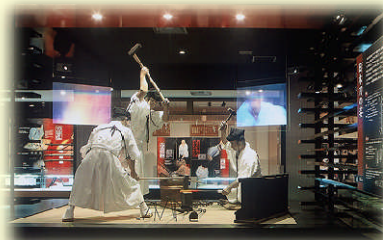
関鍛冶伝承館 (関市)