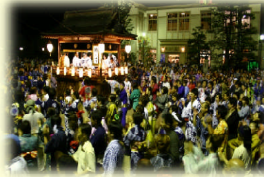
郡上おどり (郡上市八幡町)