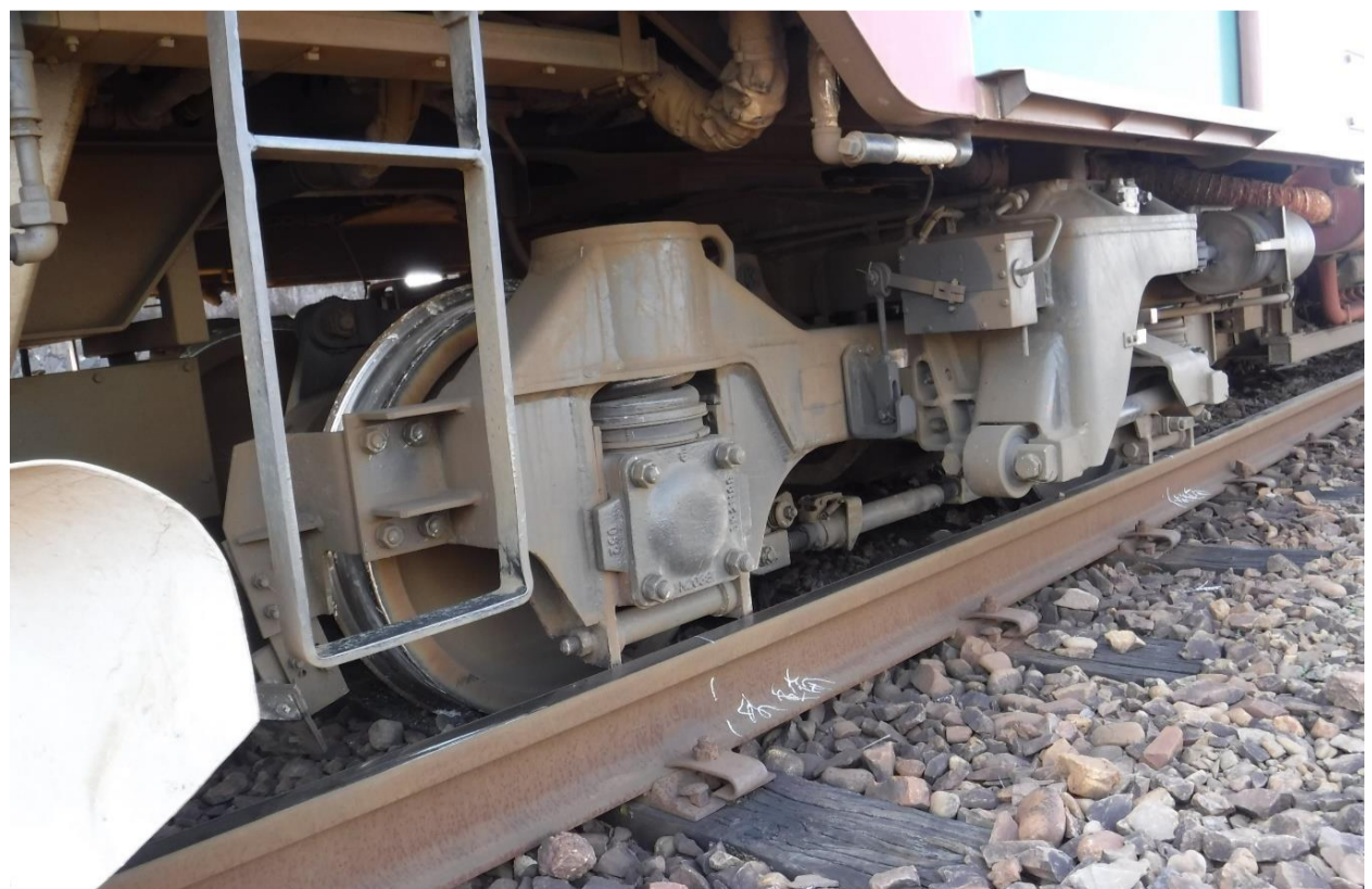
進行方向前2軸とも脱線 進行方向 左側から撮影