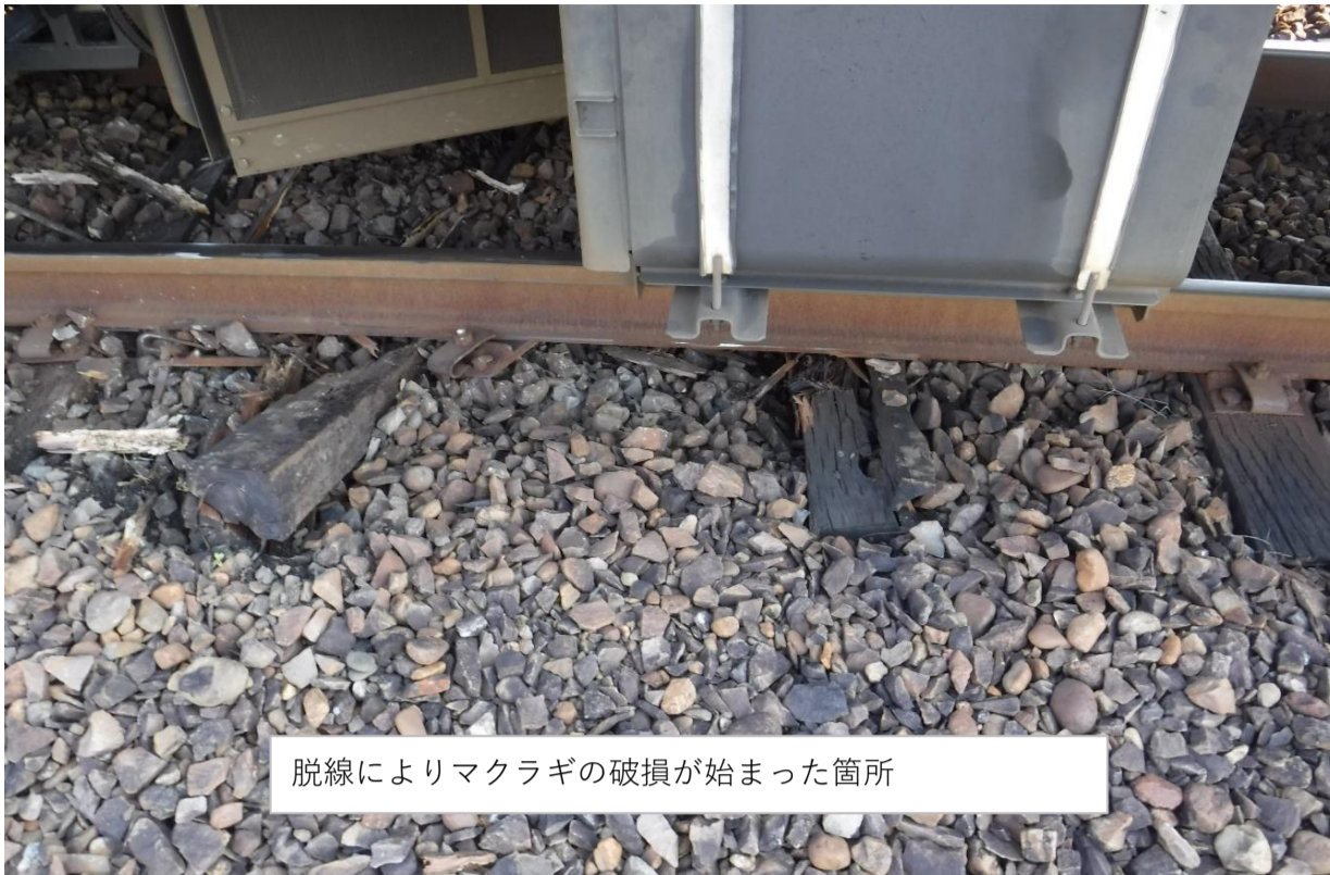
脱線によりマクラギの破損が始まった箇所