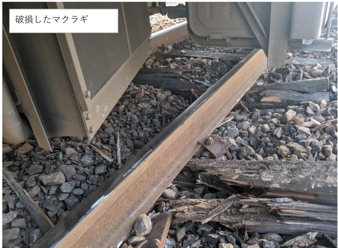
破損したマクラギ