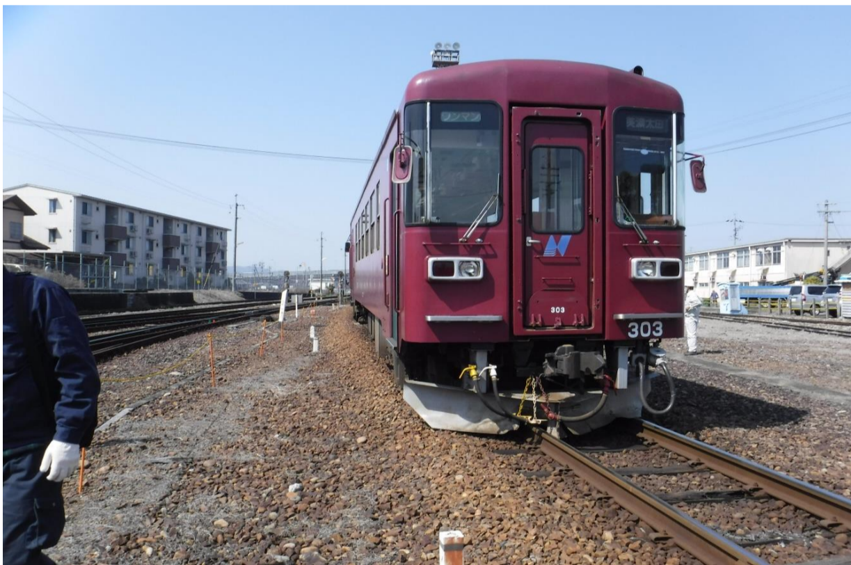
脱線車両 美濃太田方から撮影