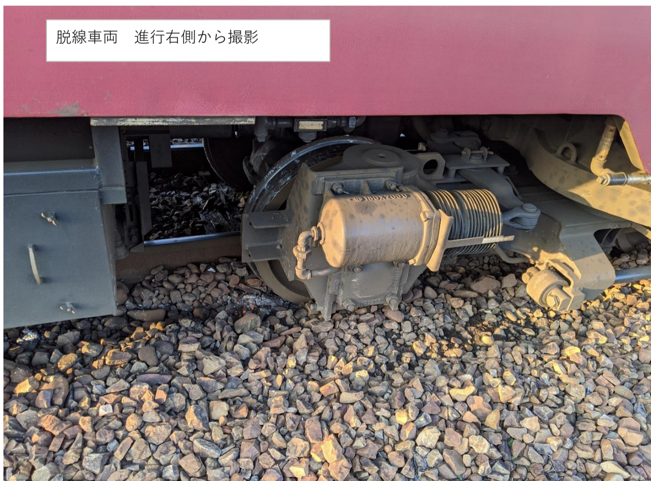
脱線車両 進行右側から撮影