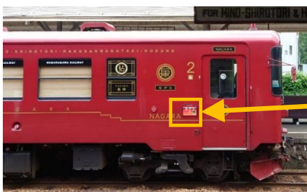
10周年記念外装サボ