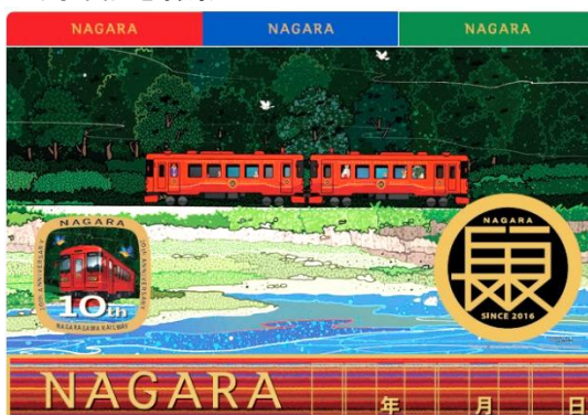
10周年記念撮影パネル