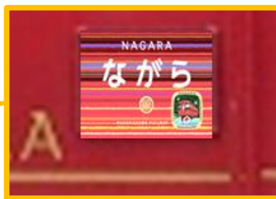
サボ設置イメージ写真